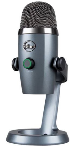
Blue Yeti Nano Valitse kardioidi suuntakuvio