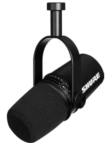
Shure MV7 + jalusta / kolmijalka

* Parhaat lisävarusteet (jalusta, iskunvaimennin) ja käyttäjäystävällinen (suuntakuvion vaihtomahdollisuus)