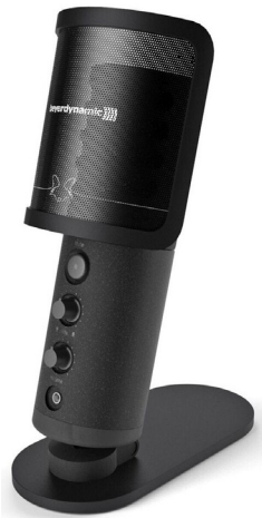
Beyerdynamic FOX Valitse high gain -toiminto