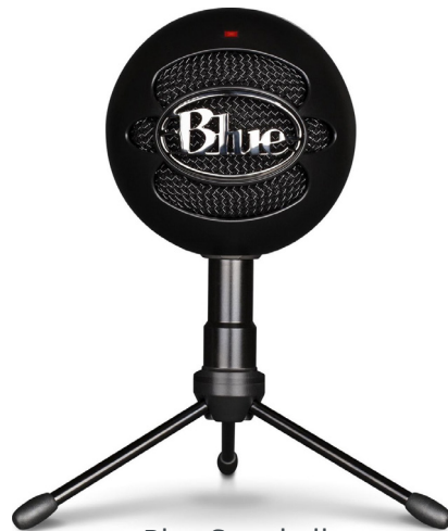
Blue Snowball Valitse kardioidi suuntakuvio