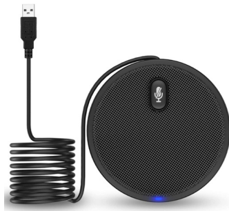
Pallomikrofoni (eli monisuuntainen)