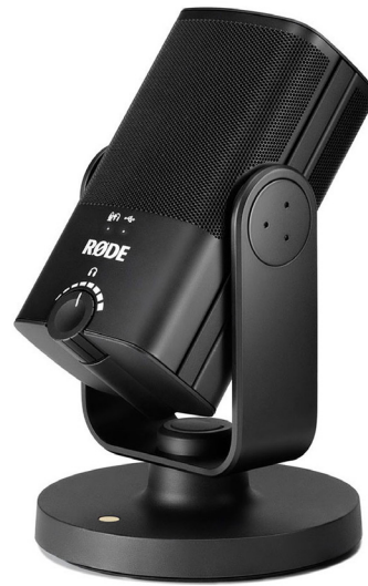
Yksisuuntainen USB-pöytämikrofoni 125Hz - 15000Hz