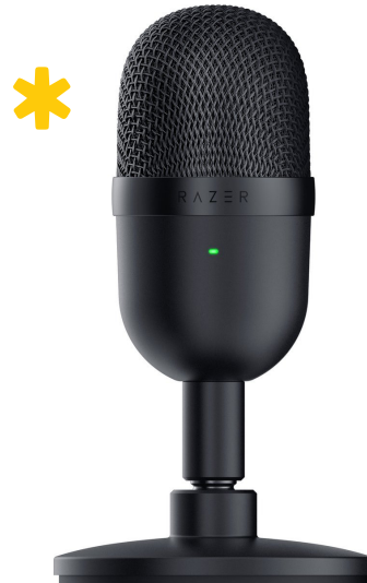
Razer Seiren Mini