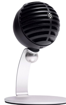
Shure MV5 Valitse neutraali asetus