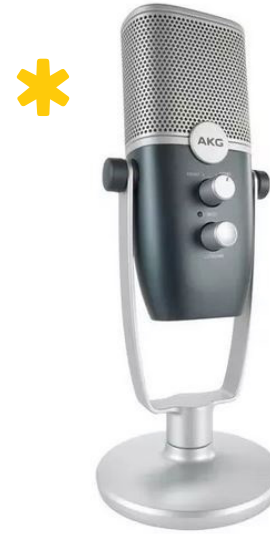
AKG ARA Valitse kardioidi suuntakuvio