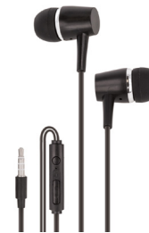
Kuulokkeet, joiden johdossa on mikrofoni